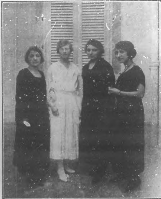
Cuerpo de profesoras del magnífico colegio y kindergarten "San Vicente".