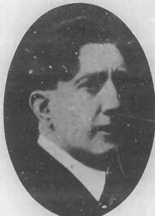
RICARDO PUGA Notable primer actor, que es una de las figuras principales de la compañía que trae Benavente.