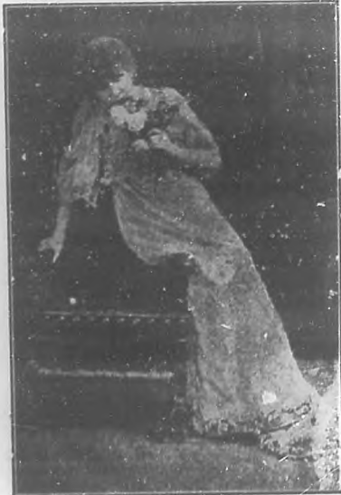
Sarah Bernhardt en "La Dama de las Camelias".

Y esa fue siempre la fiel imagen de la inmortal artista que durante más de medio siglo visitó todo el mundo civilizado distribuyendo con mano pródiga las flores de su arte, que fueron las virtudes de sus nervios.