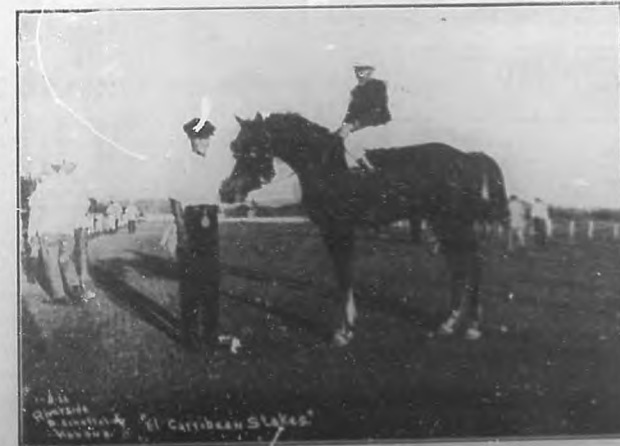
"Riverside", ejemplar de la cuadra cubana que se nombra "The Cairnito and Guanábana Stable" y que ganó la primera carrera este año de esa cuadra, en la tarde del martes último.

*** No obstante encontrarse alojados en Oriental Park muy cerca de 600 caballos, éstos siguen llegando, lo mismo que jockeys, pues del mes entrante es adelante, al mejorar violentamente nuestra situación económica, y la arribación del turismo es tan en su apogeo, la animación en el Hipódromo no ha de tener antecedentes en temporadas anteriores. Todo hace esperar que el circuito a cargo de la Cuba American Jockey and Auto Club, o sea el hipódromo Oriental Park con su enorme y valiosísimo C-b-house, el Casino y el hotel Almendares, esté en las mejores y más amplias condiciones de producir a lo que la mencionada animación tiene sembrado en ese circuito. Y el público elegante y pacífico de nuestra capital, así como el rico turismo que nos visita, han de tener motivos sobrados para regocijarse, que nuestra capital no ha de ser siempre una ciudad adormida, que por algo Dios la colocó al hacer la topografía de la tierra en el paso de los mundos.