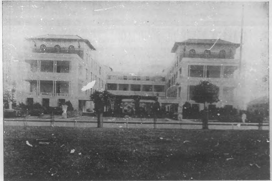
Gran hotel "Almendares", a cargo de la compañía del hipódromo "Oriental Park", donde se encuentra el mejor confort y se vive en la zona de "sports" de la Habana.

La actual temporada hípica, que es la novena, se inició con la novedad de la supresión de los books, las casetas de los basquetos, que aparte de las Mutuas presentaban cotizaciones a los apostadores, dándoles en muchos casos, casi siempre, la norma para definir los tips.