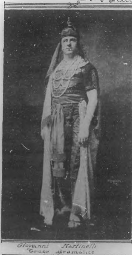
Giovanni Martinelli "Genio dramático"

La apertura de la temporada del Metropolitan Opera House tuvo lugar el sábado lunes de noviembre, no con "Mefistófeles", como había anunciado, sino con "Tosca", el celebre drama de Victorien Sardou, con música de Puccini. El teatro presentaba un aspecto brillante. Los palcos y butacas esta-