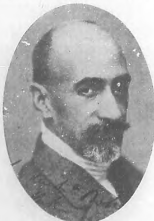
DON JACINTO BENAVENTE El ilustre comediógrafo español, que ha sido huésped de Cienfuegos durante varios días.

La actualidad cienfueguera desde el día 20 al 25 de diciembre la ha constituido el ilustre dramaturgo don Jacinto Benavente, gloria legítima de la intelectualidad española, maestro de la literatura al que rinden devoto homenaje de admiración todos los