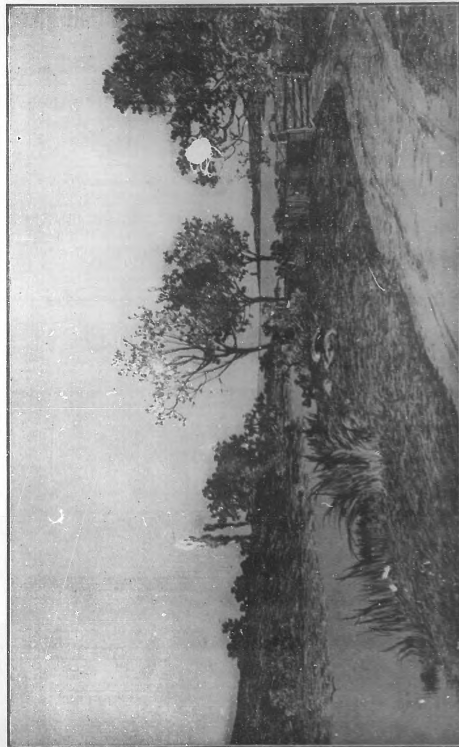
(Grabado tricheir de BOHEMIA.)

¡Acercaos divinas Horas, no gustadas, antes que el buen peregrino caiga en la senda!