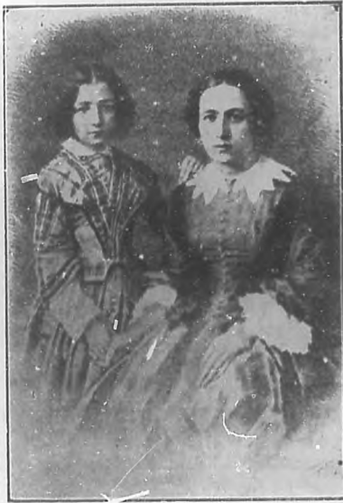
Sarah Bernhardt, niña aún, en compañía de su madre.

Los comienzos de su nueva campaña en el Teatro Francés fueron ardua labor sin resultados positivos. Pero llegó la Esfige de Feuillet y Sarah se impuso. El sublime triunfo que alcanzó en la creación de Fedra revolucionó a París. Y fué aurora magnífica de ocho años de continuados laureles conquistados con "La Hija de Rolando", la "Estranjera", "Andromaca", "Anfitrión" y "Zaira". (Pasa a la Pág. 18.)