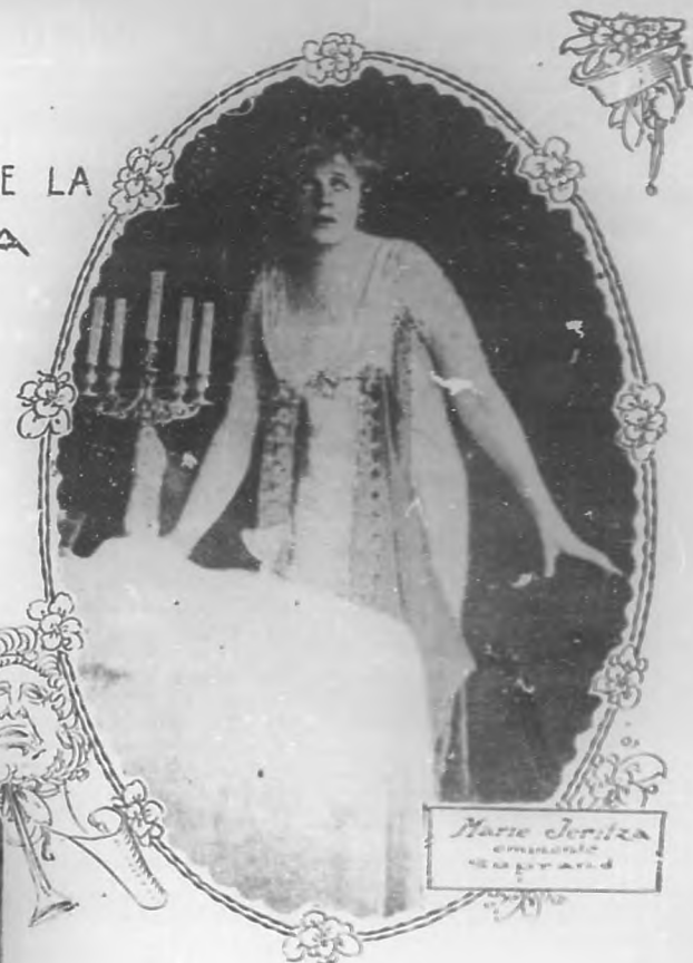
Marie Jeriza "Supremacía"

La apertura de la temporada del Metropolitan Opera House tuvo lugar el sábado lunes de noviembre, no con "Mefistófeles", como había anunciado, sino con "Tosca", el celebre drama de Victorien Sardou, con música de Puccini. El teatro presentaba un aspecto brillante. Los palcos y butacas esta-